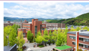
京都工芸繊維大学

公式サイト : https://sig4dff.org/conference/2025/